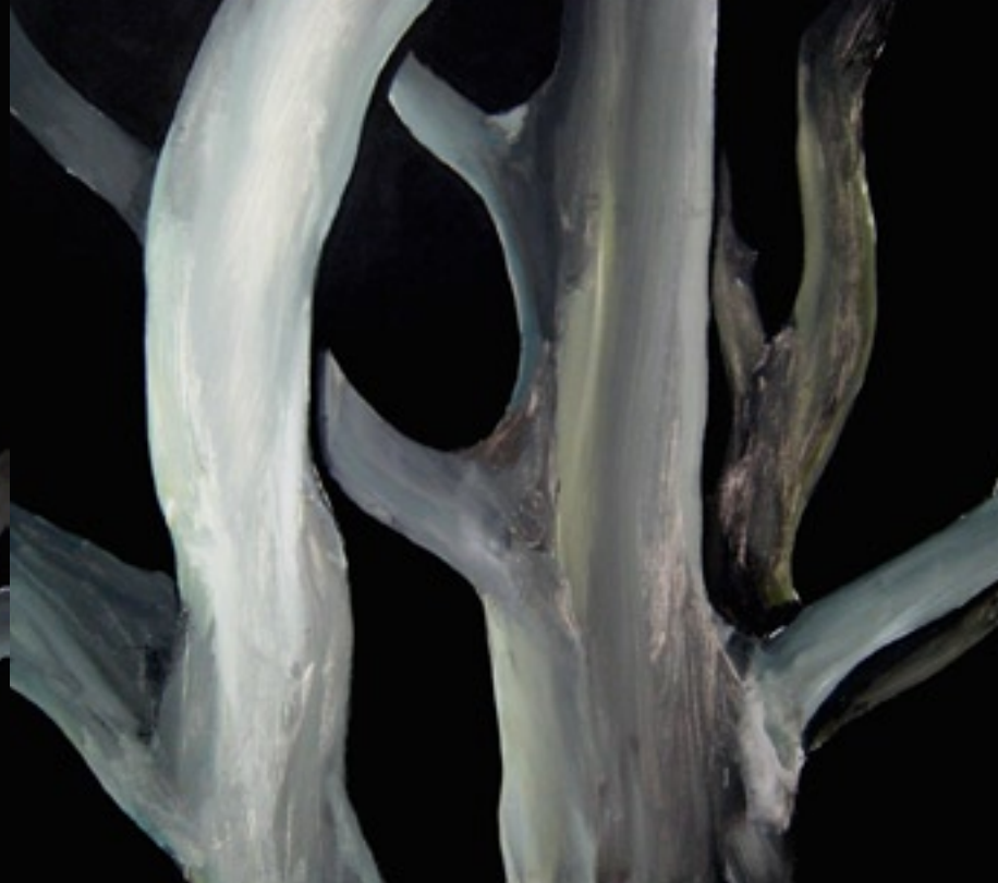
Sin título. 2007 180 x 160 cm. Acrílico / Tela