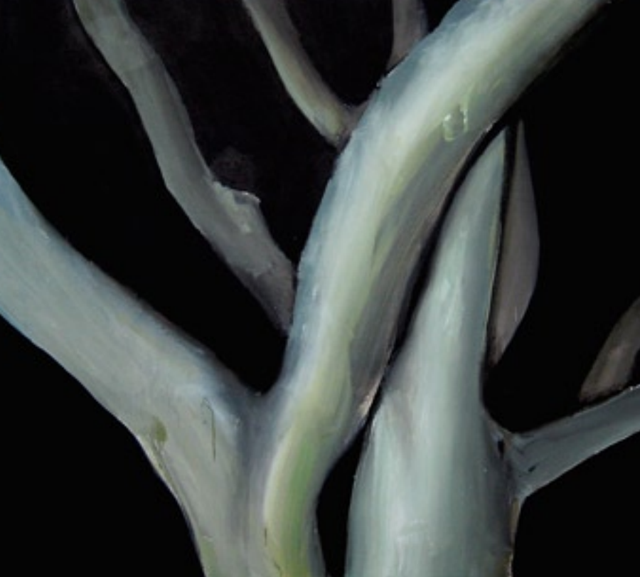
Sin título. 2007 180 x 160 cm. Acrílico / Tela