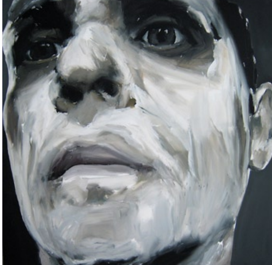
Sin título. 2007