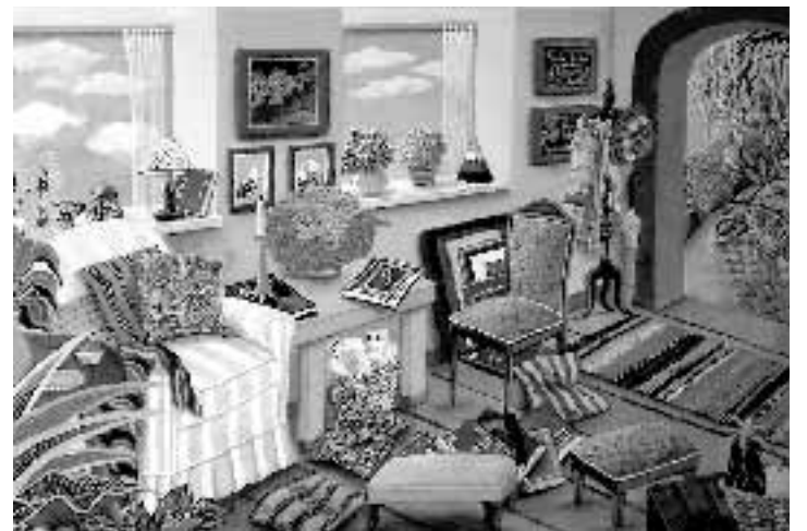
DETALLES. 'Salita amarilla', una de las obras expuestas.